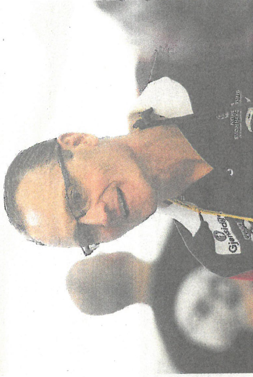
LIKER DET HAN SER: Landslagssjef Petter Løvberg ser en oppsving blant de yngre svømmerne i Bergen.