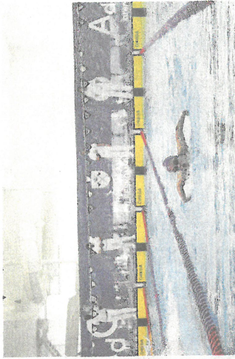
BUTTERFLY: Hanne Næss i aksjon på 200 meter butterfly.