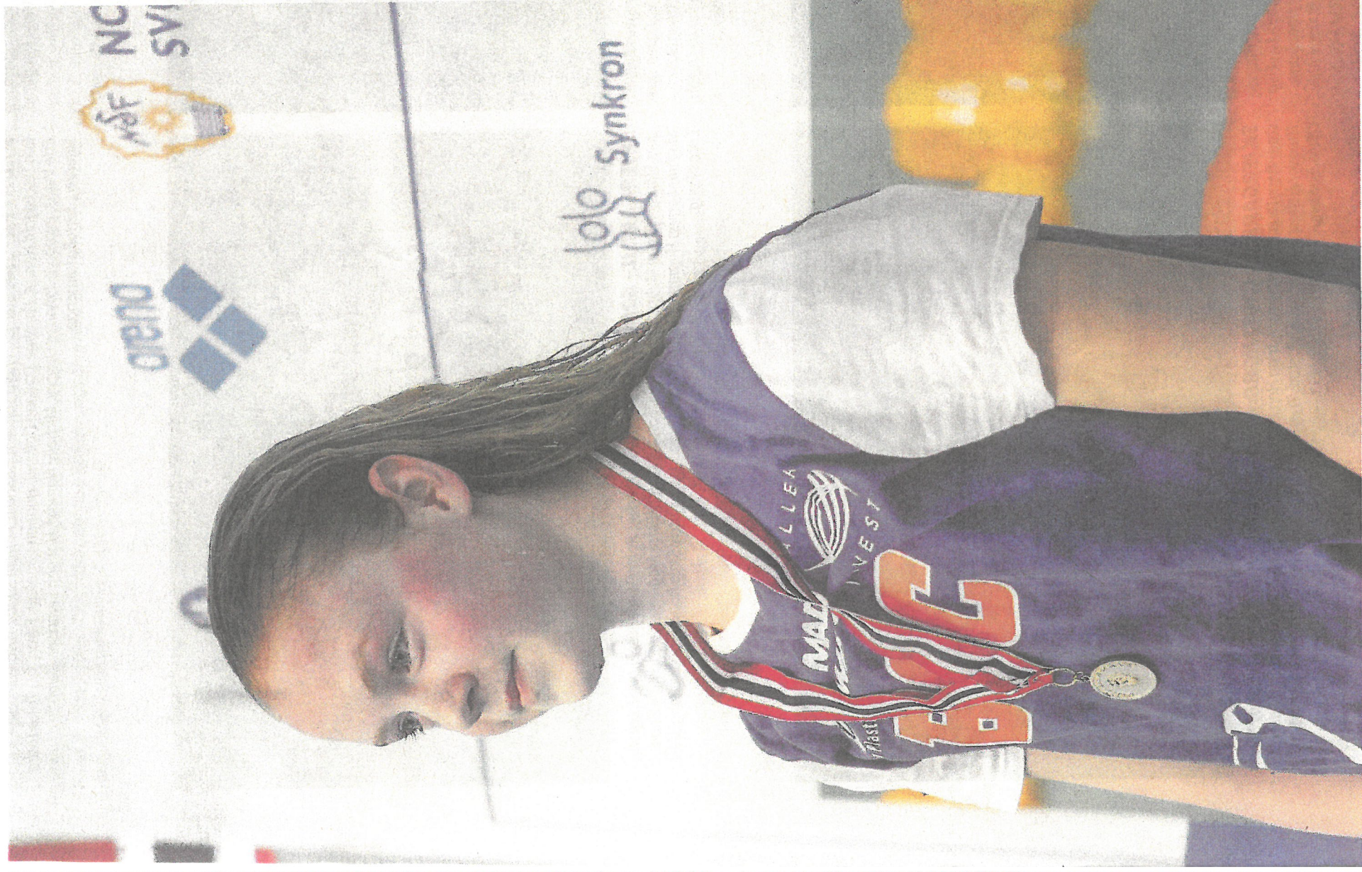
juniorlandslaget. – Det var sjokkerende. Jeg visste at jeg kunne klare det, men jeg ble likevel overrasket, sier 15-åring.